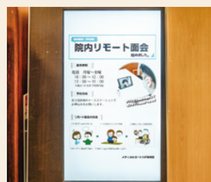
画面も大きく、さまざまなお知らせの内容が一定時間で切り替わるため、注目するようになったというご意見をいただいています。

当院1階の会計前に大型デジタルサイネージを設置しました。待ち時間を少しでも有意義に過ごしていただきたく、当院の診療内容や休診日のお知らせ、さまざまな病気に関する情報や、健診・予防接種のご案内などを見やすい文字や写真などで放映していくものです。デジタルサイネージは、急な休診のお知らせや動画にも対応できるため、今後は、さらに分かりやすく、観て飽きない内容を企画し、患者さまにとって有用なコンテンツの放映を心がけてまいります。